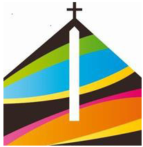
TABLE DE LA FRATERNITE